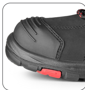
zesílená přední část proti okopu zosilnená predná časť proti okopu reinforced PVC overcap nosek z PCV wzmocnieniem