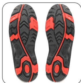
podešev podošva outsole podeszwa